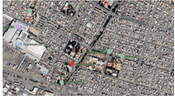
Imagen Satelital de la Zona

Estos cuerpos de agua, que originalmente formaban parte del equilibrio ecológico y del sistema natural de drenaje de la ciudad, hoy requieren intervenciones constantes de limpieza, restauración y educación ambiental para recuperar su funcionalidad.